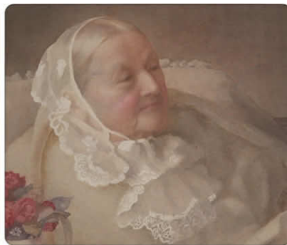
約150点もの膨大な著作を残して90年の生涯を閉じた