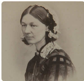
看護に目覚めてヨーロッパ中の病院・施設を精力的に回った若き日々

フローレンス・ナイチンゲール (1820~1910) Florence Nightingale